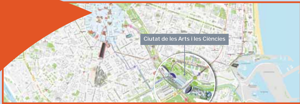
Ciutat de les Arts i les Ciències